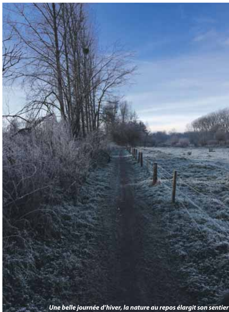
Une belle journée d'hiver, la nature au repos élargit son sentier

2 Dans le strict respect des règles sanitaires nationales, régionales et communales.