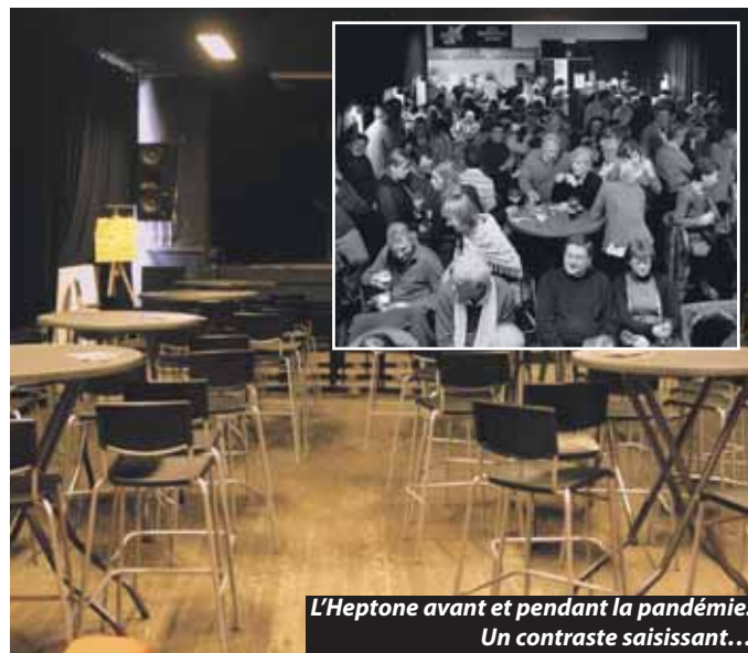
L'Heptone avant et pendant la pandémie. Un contraste saisissant...

« Pendant le premier confinement, j'ai attendu, mais le deuxième confinement a anéanti tous les espoirs de reprise. Je ne voyais pas la sortie du tunnel et je broyais du noir. Je n'ai pas étudié la musique pendant des années pour jouer seul dans mon salon. C'est un gros coup au moral et il faut une motivation de fer, qu'il faut alimenter de l'intérieur puisqu'on ne peut plus avoir de contacts vers l'extérieur. J'ai dû trouver une manière d'occuper mes journées pour trouver une énergie positive. Heureusement, j'ai la chance de vivre dans un chouette village et d'être soutenu par ma femme et les enfants, mais je pense souvent à mes collègues qui vivent seuls... ».