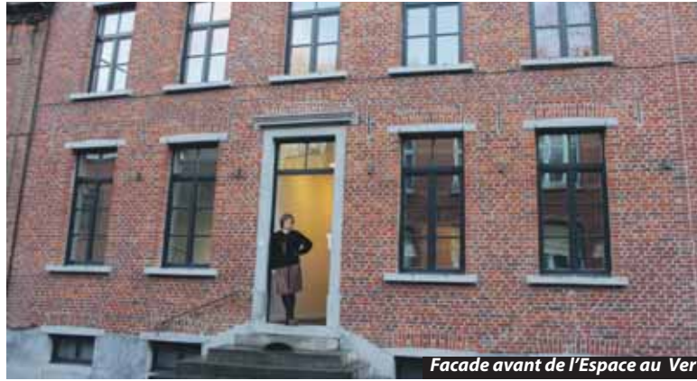
Façade avant de l'Espace au Vert