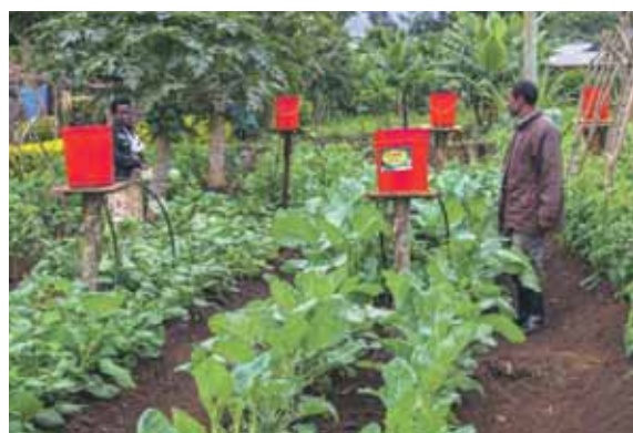
Le maraichage au moyen de systèmes simples d'irrigation goutte à goutte alimentés par des bidons et facilement réalisables par les paysans