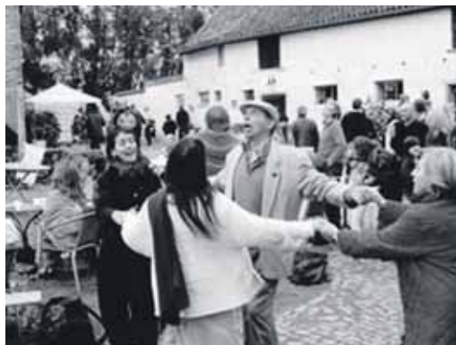
étaient autorisés, certains spectacles n'ont pas pu se faire, soit parce qu'une règle a été modifiée en der-

nière minute, soit parce que les mesures étaient trop compliquées à mettre en place ».