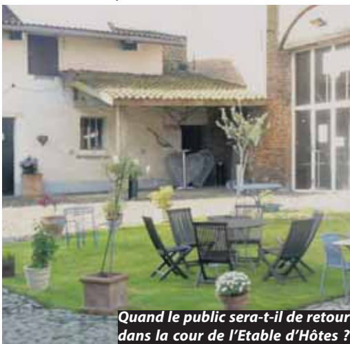
Quand le public sera-t-il de retour dans la cour de l'Etable d'Hôtes ?

L'incertitude est probablement la plus grande contrainte pour les programmeurs culturels : Quand pourront-ils reprendre ? À quelles conditions ? La séance sera-t-elle rentable si les contraintes sont trop importantes ? « Les réglementations n'ont pas arrêté de changer » explique Gus Goossens, de l' Etable d'Hôtes . « Entre les deux confinements, quand les événements culturels