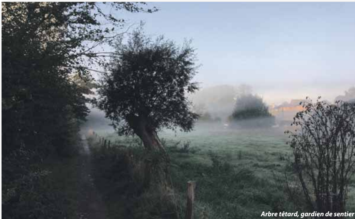
Arbre têtard, gardien de sentier

Un collectif de citoyens d'Ittre et de Virginal vous propose de relever le DÉFI D'AGIR ENSEMBLE pour compléter et renforcer la valorisation des sentiers qui représentent une part essentielle du patrimoine rural, paysager et environnemental de notre belle commune.