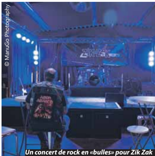
Un concert de rock en «bulles» pour Zik Zak