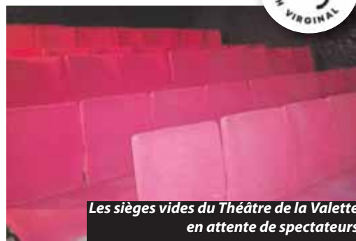
Les sièges vides du Théâtre de la Valette en attente de spectateurs