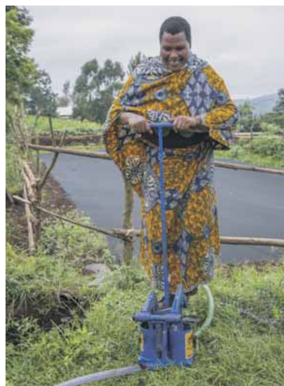
Les cultures par des pompes à pied permettant d'amener l'eau dans des endroits difficiles.