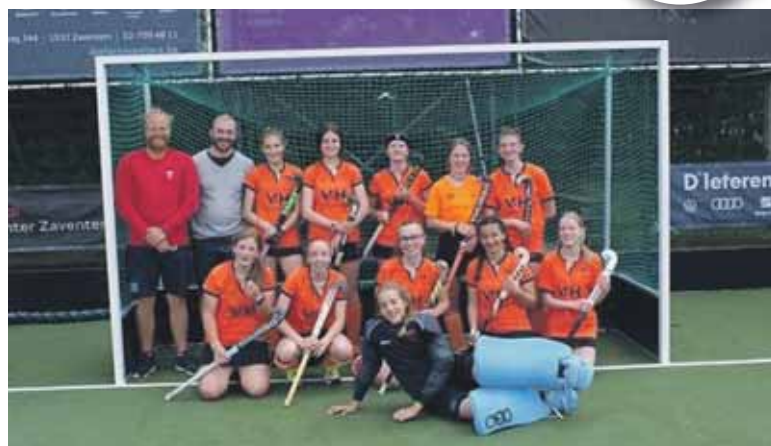
Les U16G qui, à force de combativité et de travail maintiennent la 1ère place et montent en LFH1