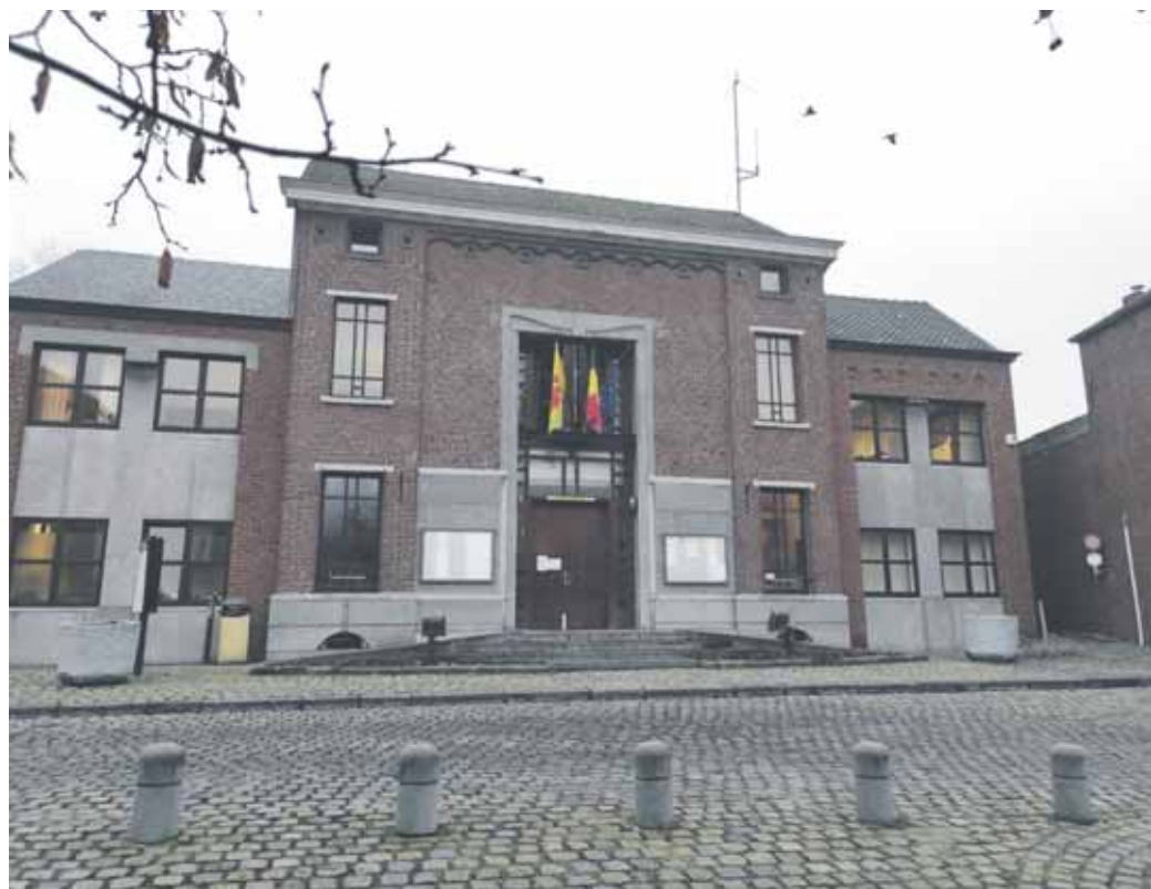
Comment préparer le futur de la Commune ?