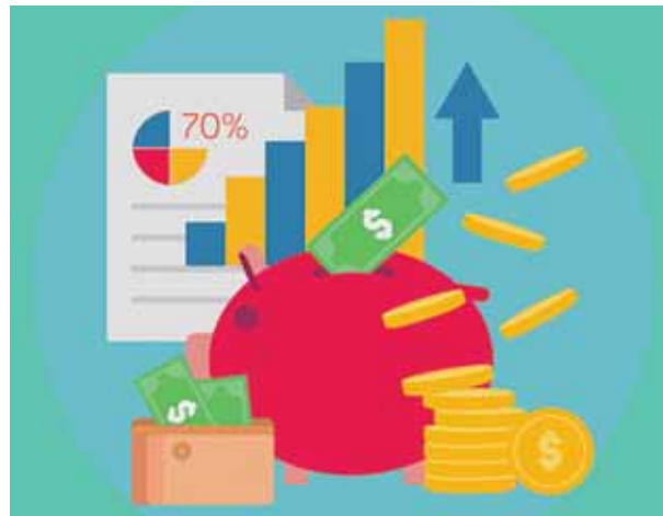
Qu'en est-il des comptes annuels 2021 de la Commune ?