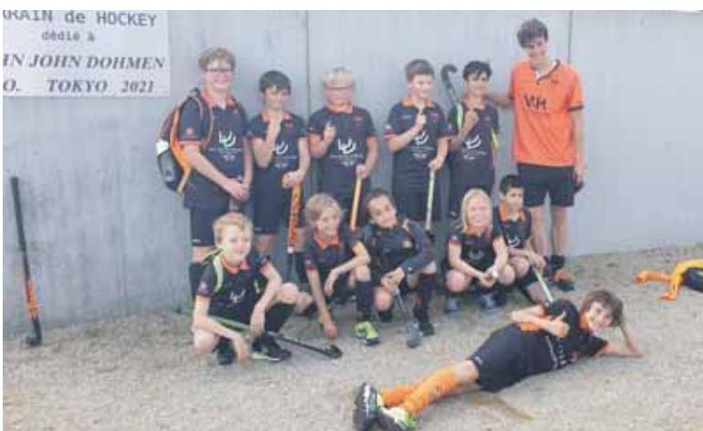
Les U11B qui terminent premiers de leur poule et monteront en LFH2 l'année prochaine