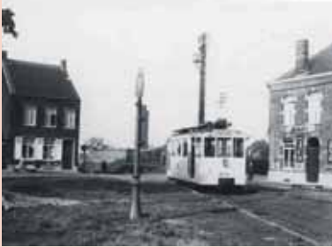
L'ancien petit tram sur le plateau du tram à Virginal le 12/05/1955 (crédit collection Vanderlinden).

Au début du XXème siècle, la ligne du tram (du vicinal) a été instaurée. Le tram servait à transporter des personnes ou du matériel. Presque toutes les localités desservies avaient leur gare. A Virginal, il y avait un entrepôt à droite dans la rue Charles Catala, un autre à gauche de l'ancien restaurant Saint Malo (aujourd'hui le restaurant 'L'autre') et l'ancienne gare de la SNCB où se trouvait un plateau tournant.