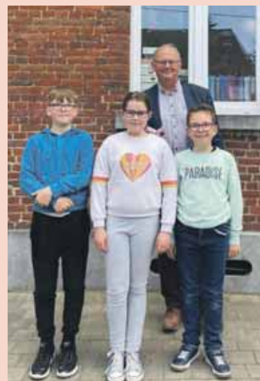
Le bourgmestre interrogé par les élèves

Personne peut prédire l'avenir, mais nous avons trouvé quelques pistes sur Virginal dans le futur.