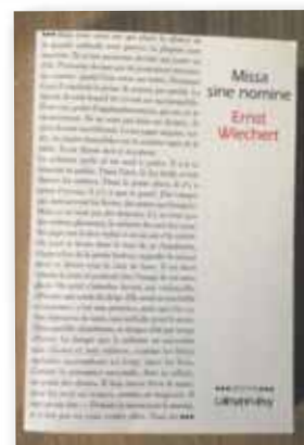
«MISSA SINE NOMINE» ERNST WIECHERT ED. CALMANN LEVY

C'est ce qui différencie sans doute un bon roman d'une œuvre intemporelle.