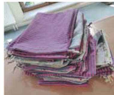
75 troussees créées pour l'asbl BruZelle