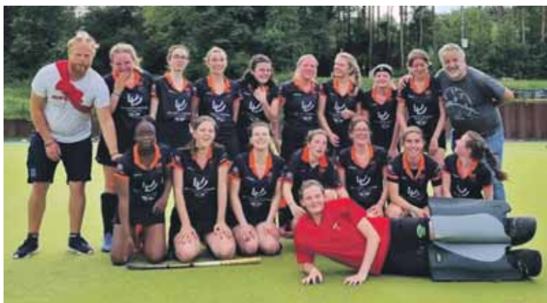
Les U19G qui se classent également au sommet et signent l'exploit de monter en national 2. Elles ne pouvaient nous offrir plus beau cadeau à quelques jours des 10 ans du club !